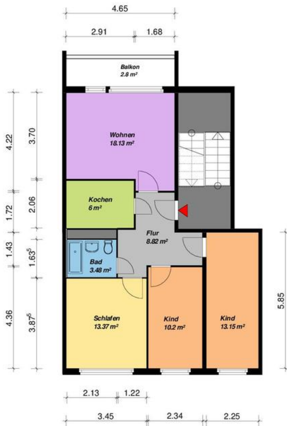
4-Raum -WE - WBS-70-Typ C2-OG-mit Balkon

Alle Maße sind am Bau zu prüfen. Geringe Abweichungen können bei der Bauausführung auftreten sein.