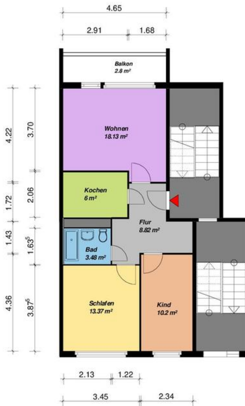
3-Raum -WE - WBS-70-Typ C2-EG-mit Balkon

Alle Maße sind am Bau zu prüfen. Geringe Abweichungen können bei der Bauausführung auftreten sein.