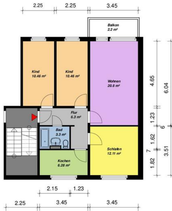
4-Raum WE Typ PN 36 rechts

Alle Maße sind am Bau zu prüfen. Geringe Abweichungen können bei der Bauausführung auftreten sein.