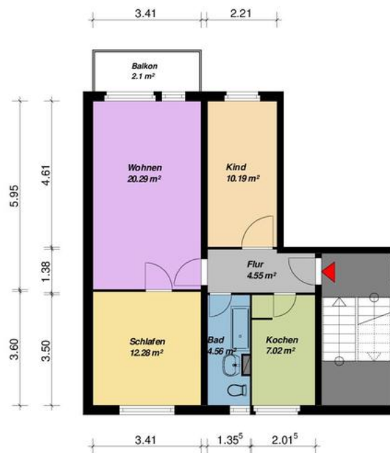
3-Raum-Wohnung-Typ Brandenburg-links, mit Balkon

Alle Maße sind am Bau zu prüfen. Geringe Abweichungen können bei der Bauausführung auftreten sein.