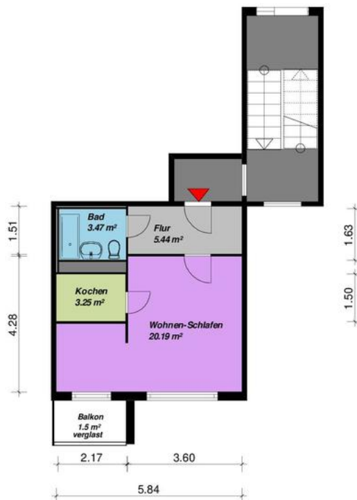
1 Raum-Wohnung, Typ C3- mit Balkon

Alle Maße sind am Bau zu prüfen. Geringe Abweichungen können bei der Bauausführung auftreten sein.