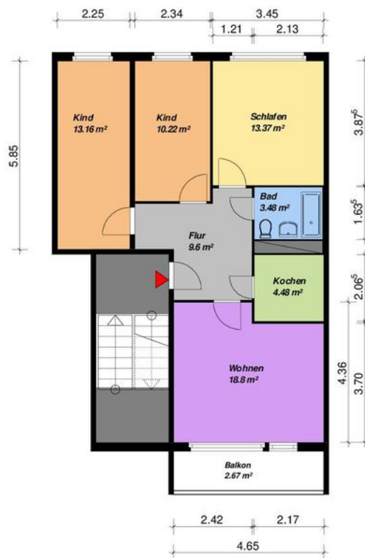
4-Raum -WE - WBS-70-Typ C1-rechts-mit Balkon Cölpiner-Straße

Alle Maße sind am Bau zu prüfen. Geringe Abweichungen können bei der Bauausführung auftreten sein.