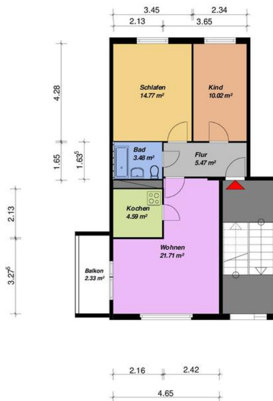
3-Raum-WE - WBS-70-Typ C7 -mit Balkon

Alle Maße sind am Bau zu prüfen. Geringe Abweichungen können bei der Bauausführung auftreten sein.