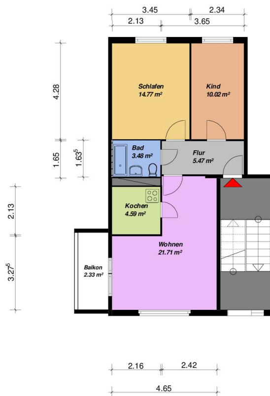
3-Raum-WE - WBS-70-Typ C7 -mit Balkon

Alle Maße sind am Bau zu prüfen. Geringe Abweichungen können bei der Bauausführung aufgetreten sein.