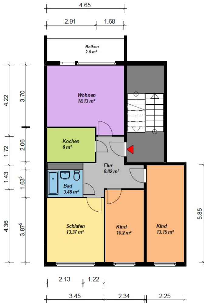
4-Raum-WE - WBS-70-Typ C2 -OG-mit Balkon

Alle Maße sind am Bau zu prüfen. Geringe Abweichungen können bei der Bauausführung auftreten sein.