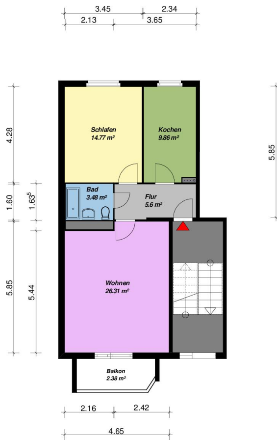
2-Raum -WE - WBS-70-Typ C7 Küche mit Fenster, Balkon

Alle Maße sind am Bau zu prüfen. Geringe Abweichungen können bei der Bauausführung auftreten sein.