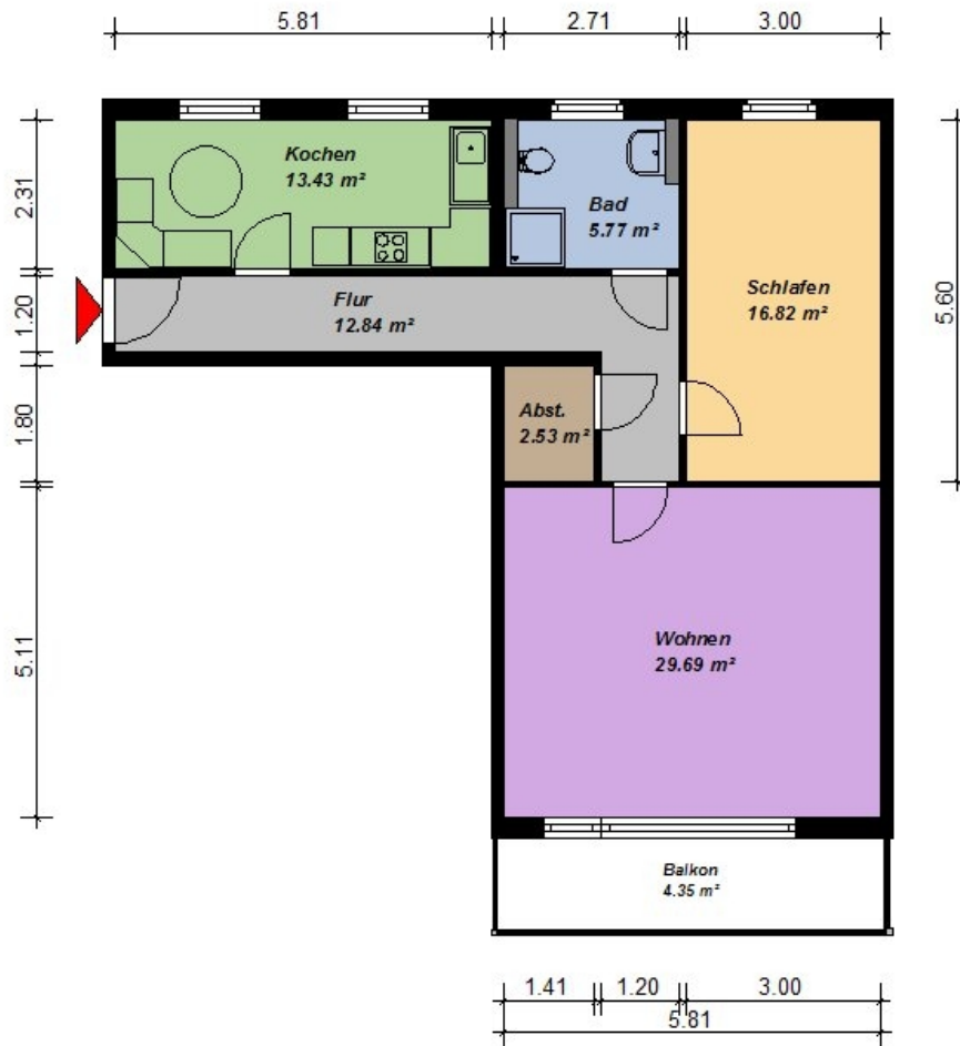
2 Raum Wohnung 13 Obergeschoss

Alle Maße sind am Bau zu prüfen. Geringe Abweichungen können bei der Bauausführung aufgetreten sein.