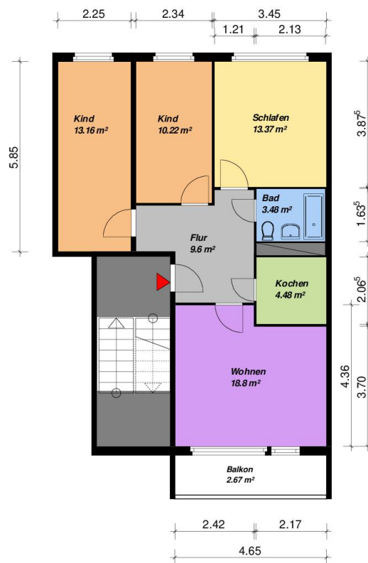
4-Raum -WE - WBS-70-Typ C1-rechts-mit Balkon

Alle Maße sind am Bau zu prüfen. Geringe Abweichungen können bei der Bauausführung aufgetreten sein.