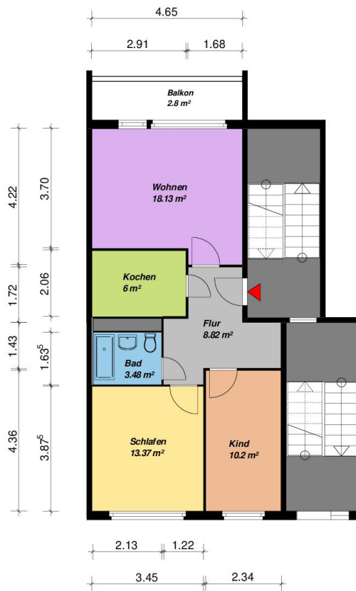
3-Raum -WE - WBS-70-Typ C2 -EG-mit Balkon

Alle Maße sind am Bau zu prüfen. Geringe Abweichungen können bei der Bauausführung aufgetreten sein.