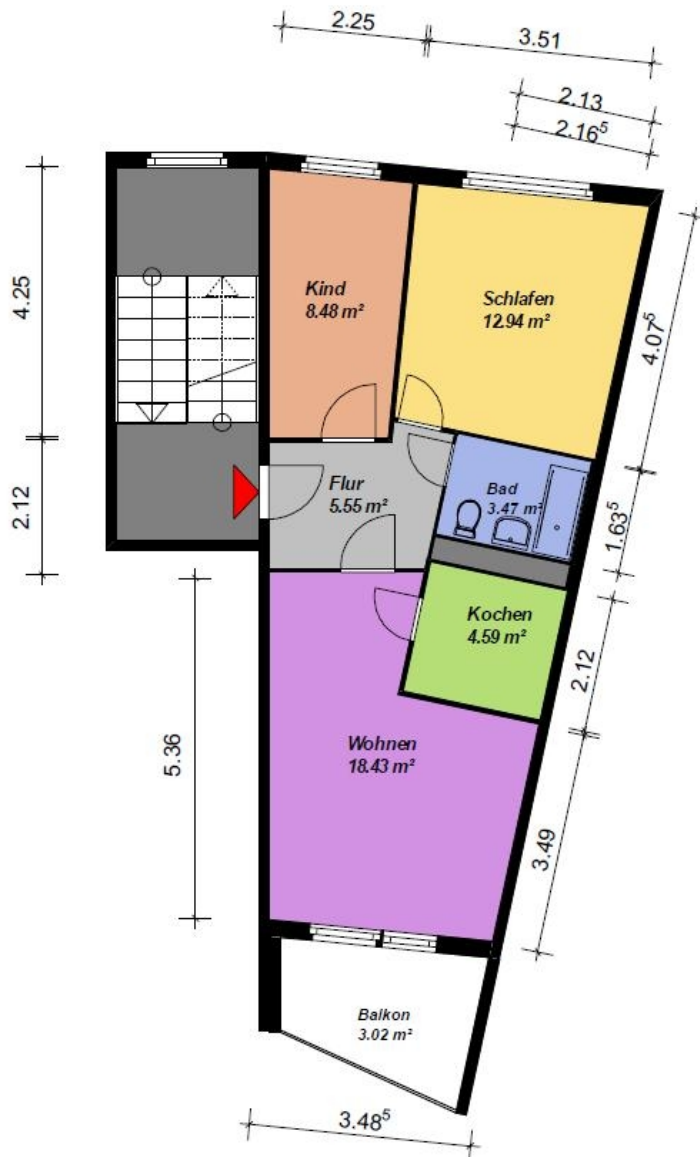
3 Raum-Wohnung, WBS 70, Typ HH, Segment A- Keil-mit Balkon