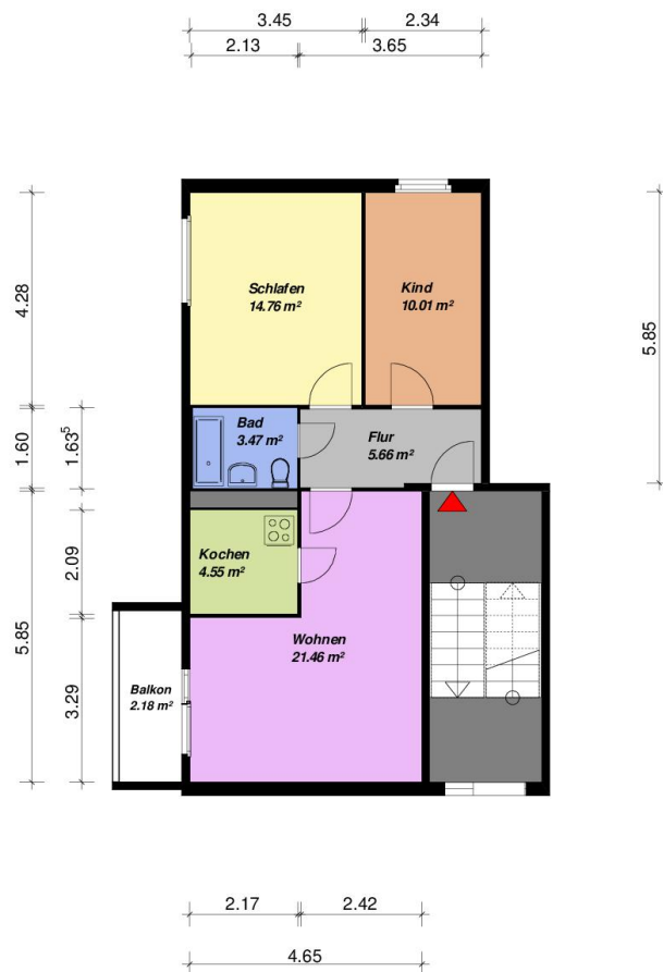
3-Raum - WE - WBS-70-Typ C7 -mit Balkon

Alle Maße sind am Bau zu prüfen. Geringe Abweichungen können bei der Bauausführung aufgetreten sein.