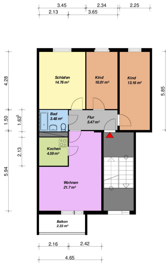
4-Raum -WE - WBS-70-Typ C7 -mit Balkon

Alle Maße sind am Bau zu prüfen. Geringe Abweichungen können bei der Bauausführung auftreten sein.