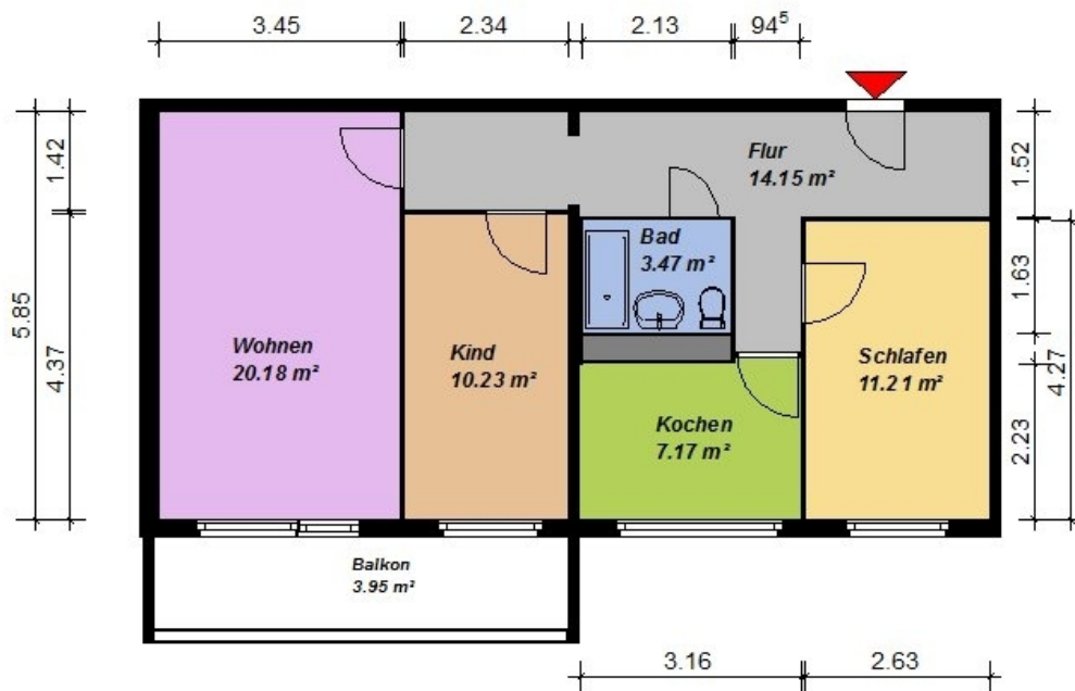
3 Raum-Wohnung, WBS 70, Typ HN 4, Obergeschoss mit Balkon

Alle Maße sind am Bau zu prüfen. Geringe Abweichungen können bei der Baueusführung aufgetreten sein.