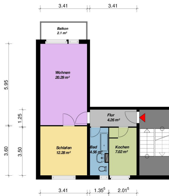
2-Raum-Wohnung-Typ Brandenburg-links, mit Balkon

Alle Maße sind am Bau zu prüfen. Geringe Abweichungen können bei der Bauausführung aufgetreten sein.