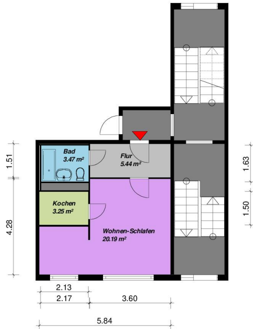
1 Raum-Wohnung, Typ C3- ohne Balkon

Alle Maße sind am Bau zu prüfen. Geringe Abweichungen können bei der Bauausführung auftreten sein.