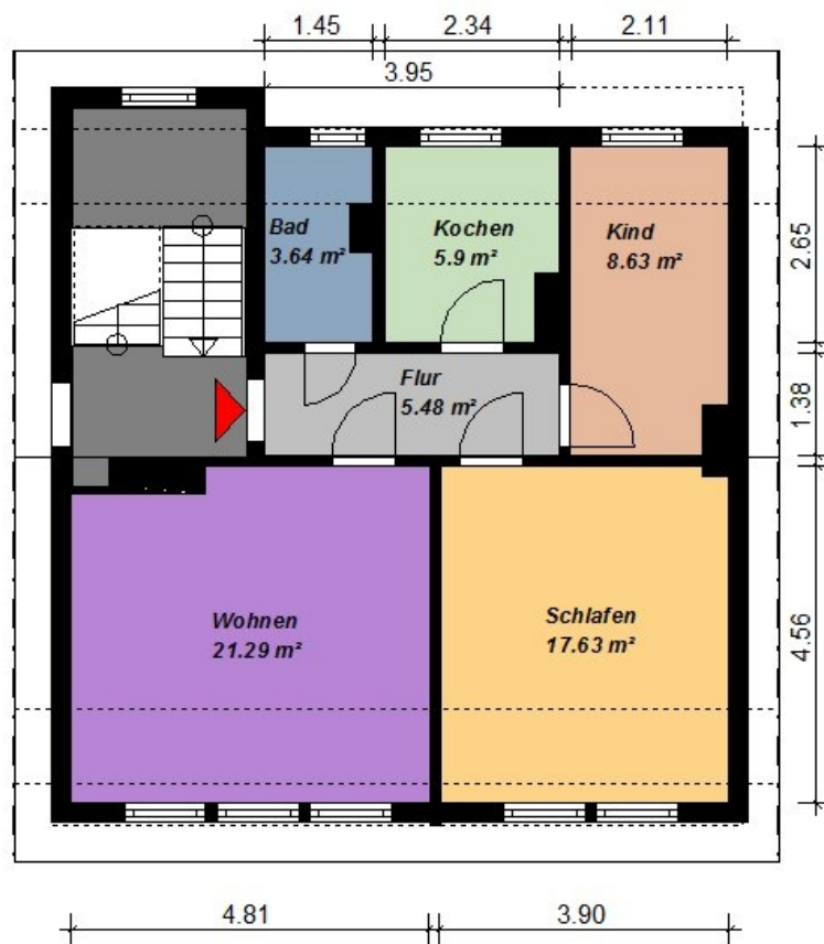
3-Raum Wohnung - Prenzlauer Str. 4 - Whg. 13 Dachgeschoss

Alle Maße sind am Bau zu prüfen. Geringe Abweichungen können bei der Bauausführung aufgetreten sein.