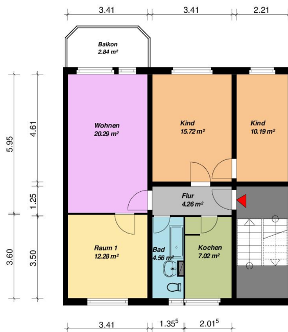
4-Raum-WE, Typ Brandenburg- links, mit Balkon

Alle Maße sind am Bau zu prüfen. Geringe Abweichungen können bei der Bauausführung aufgetreten sein.