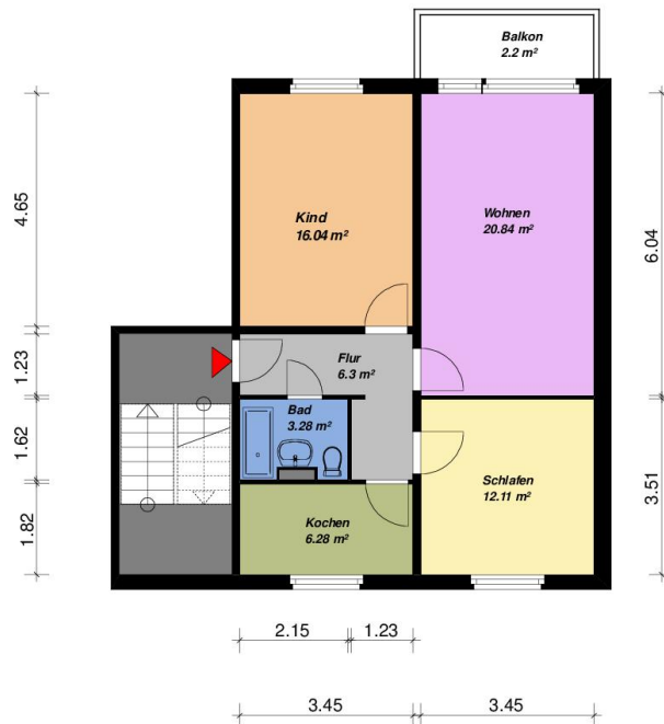
3-Raum-WE, Typ PN 36 rechts

Alle Maße sind am Bau zu prüfen. Geringe Abweichungen können bei der Bauausführung auftreten sein.