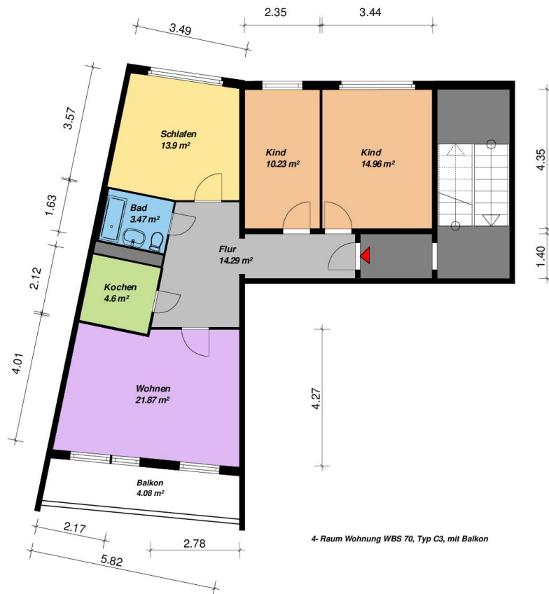
4-Raum Wohnung WBS 70, Typ C3, mit Balkon

Alle Maße sind am Bau zu prüfen. Geringe Abweichungen vom Projekt können bei der Bauausführung aufgetreten sein.