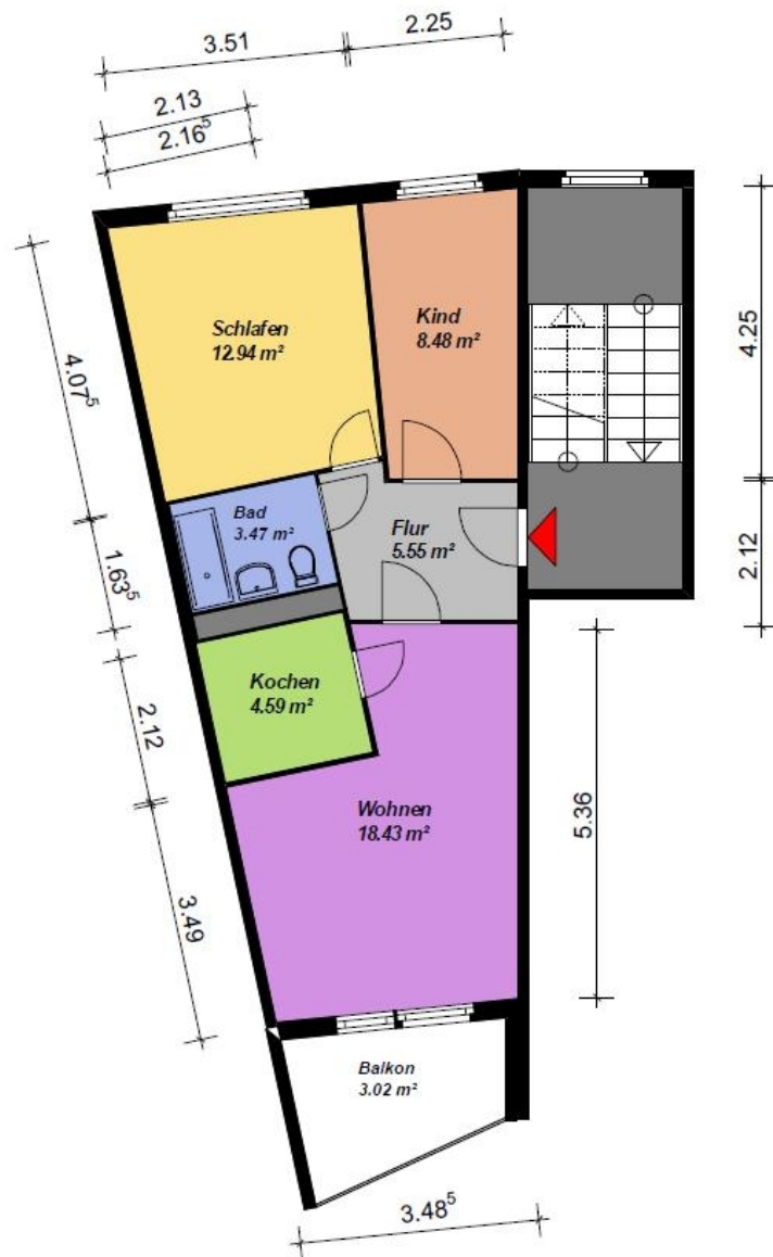
3 Raum-Wohnung, WBS 70, Typ HH, Segment A - rechts- Keil-mit Balkon