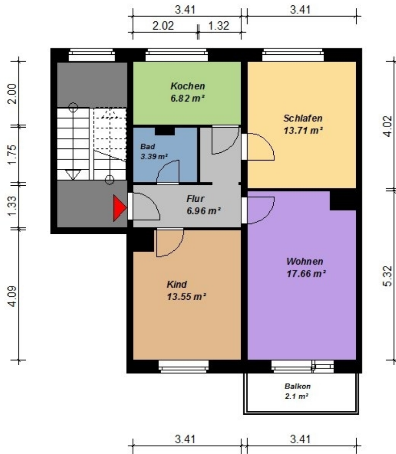
3 Raum-Wohnung, Typ Q 3- mit Balkon

Alle Maße sind am Bau zu prüfen. Geringe Abweichungen können bei der Bauausführung auftreten sein.